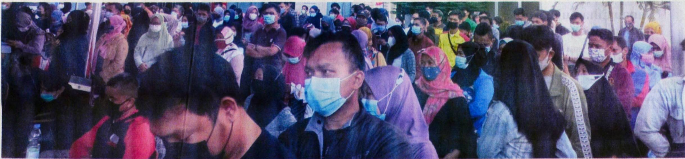
BERDESAKAN: Ratusan orang rela berdesakan, berdiri, antre agar bisa divaksin di sentra-sentra vaksin di Kabupaten Karawang. Seperti tampak dalam gambar situasi vaksinasi di Universitas Buana Perjuangan. Tujuan mereka divaksin pun beragam, tidak hanya agar terhindari dari virus corona. Tapi juga sebagai syarat bekerja, agar bisa masuk mal, dan bisa bepergian ke luar kota.