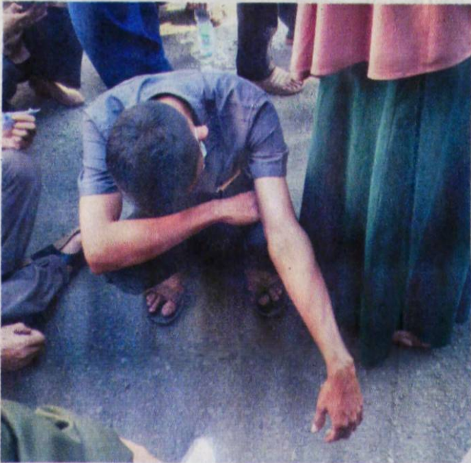
MENUNDUK: Tak kuat berdiri menunggu giliran, seorang peserta memilih jongkok dan menunduk.