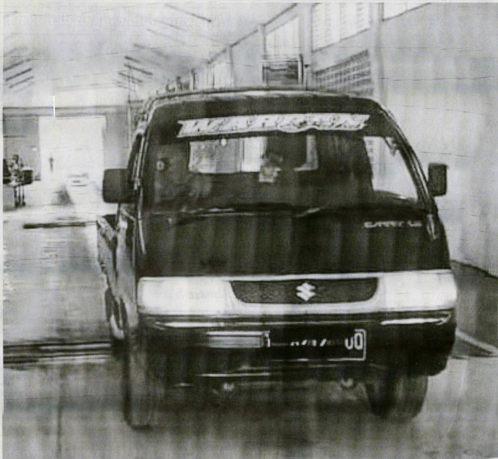
UJI EMISI: Satu unit mobil angkutan barang sedang diuji emisinya di UPTD Pengujian Kendaraan Bermotor Dinas Perhubungan Kabupaten Karawang, kemarin.

kendaraan, seperti radio, pendingin udara, atau lampu. Pengujian emisi dilakukan selama 5-7 menit. Setelah selesai, kadar dan kandungan zat pada asap kendaraan akan dicatat. Adapun kandungan zat yang dideteksi adalah CO (Karbon Monoksida), HC (Hidrokarbon), CO2 (Karbon Dioksida), O2 (Oksigen), dan NO (Nitrogen Oksida). (psn/dis)